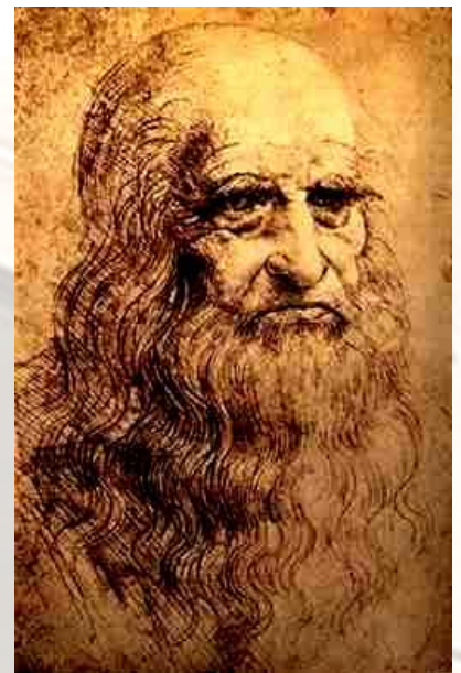
Autoportrait 1512 - 1515

À la fois peintre , sculpteur , architecte , ingénieur et scientifique , ce Florentin est une des grandes figures de la Renaissance . Passionné de connaissance et de recherche scientifique, il a été tout à la fois capable de laisser le tableau le plus célèbre du monde et des « inventions » qui n'ont été menées à bonne fin que quelques siècles plus tard.