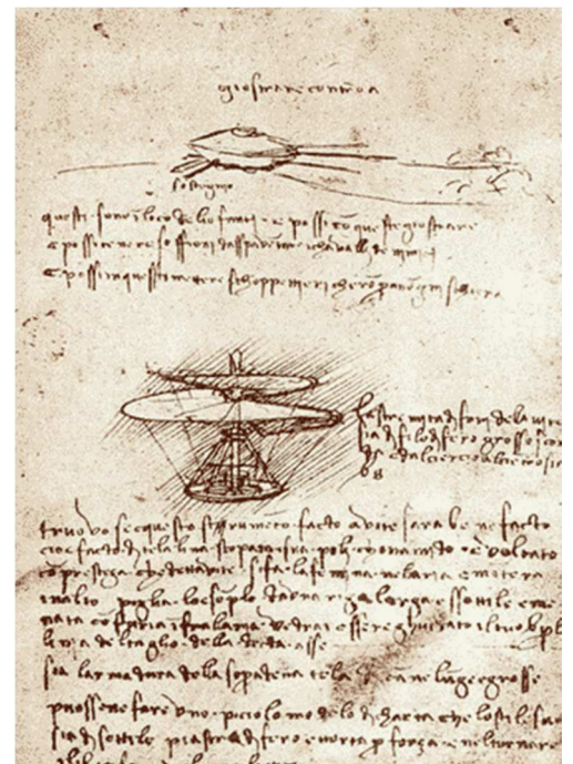
Page du manuscrit B de Léonard de Vinci concernant des projets de machines volantes En bas : le dessin d'un hélicoptère

Parmi ces plus célèbres inventions, on trouve : parachute, hélicoptère, char d'assaut, palan, engrenage, manivelle, roue dentée, etc.