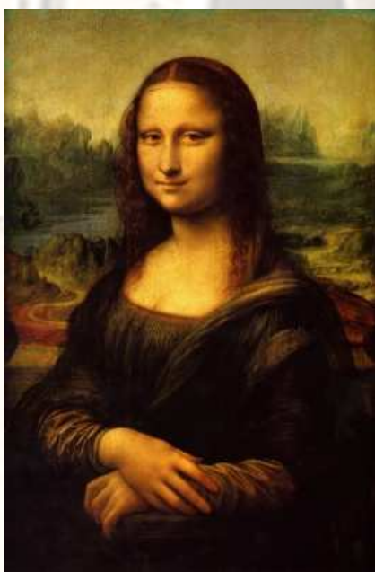
Mona Lisa ou La Joconde peinture sur bois (77 x 53 cm) 1503 - 1506

Le 2 mai 1517, il décède à l'âge de 67 ans, au château de Clos-Lucé où il résidait.